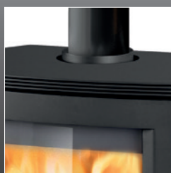
Uscita fumi superiore