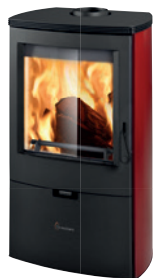
Metallo Rosso opaco