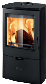
Metallo Nero opaco